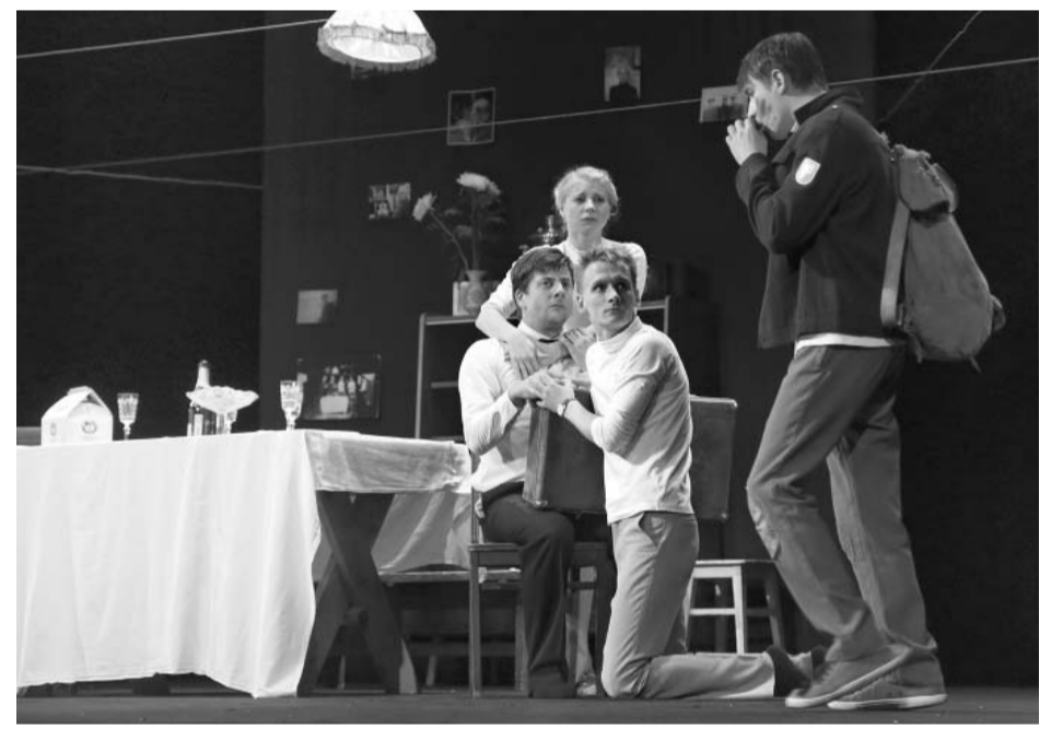
Сцены из спектакля «Старший сын» Санкт-Петербургского государственного театра «Мастерская»