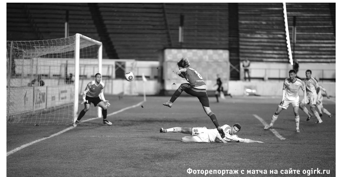
Фоторепортаж с матча на сайте ogirk.ru