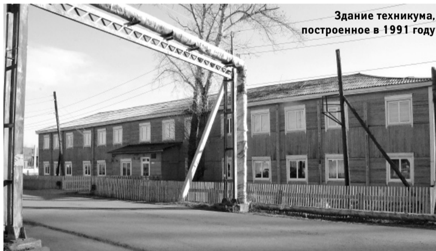
Здание техникума, построенное в 1991 году

Новое название — «аграрный техникум» — пока еще не совсем привычно для боханцев, учебное заведение все еще часто называют более привычным — ПУ-57 (профессиональное училище № 57). Но проведе-