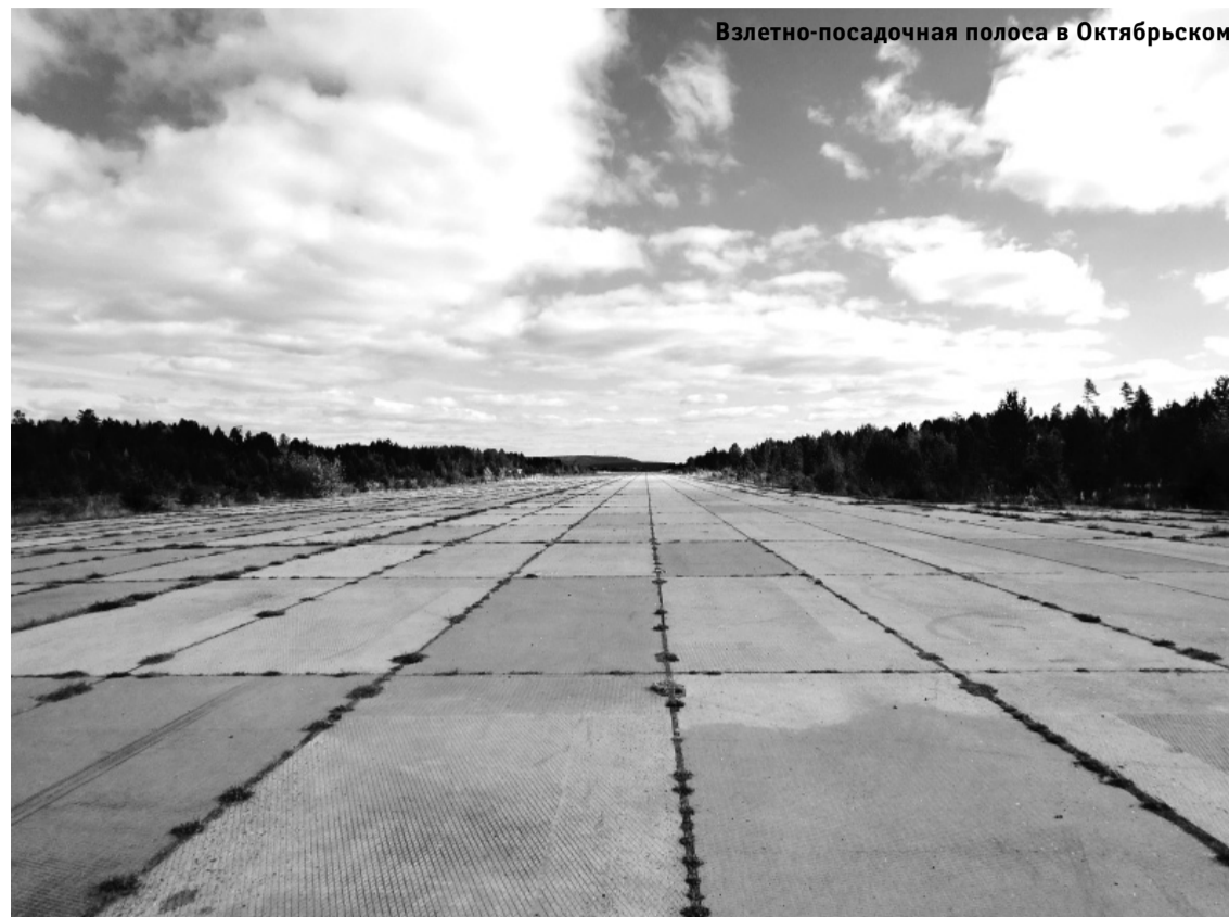
Взлетно-посадочная полоса в Октябрьском

В истории освоения сибирского неба часто встречается слово «первый»: воздухоплава-