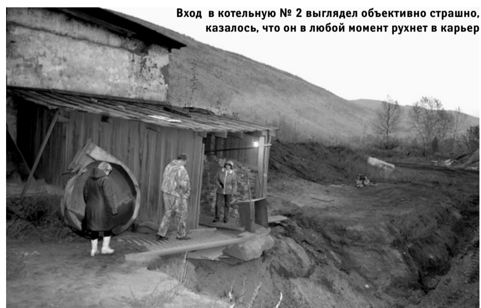
Вход в котельную № 2 выглядел объективно страшно, казалось, что он в любой момент рухнет в карьер