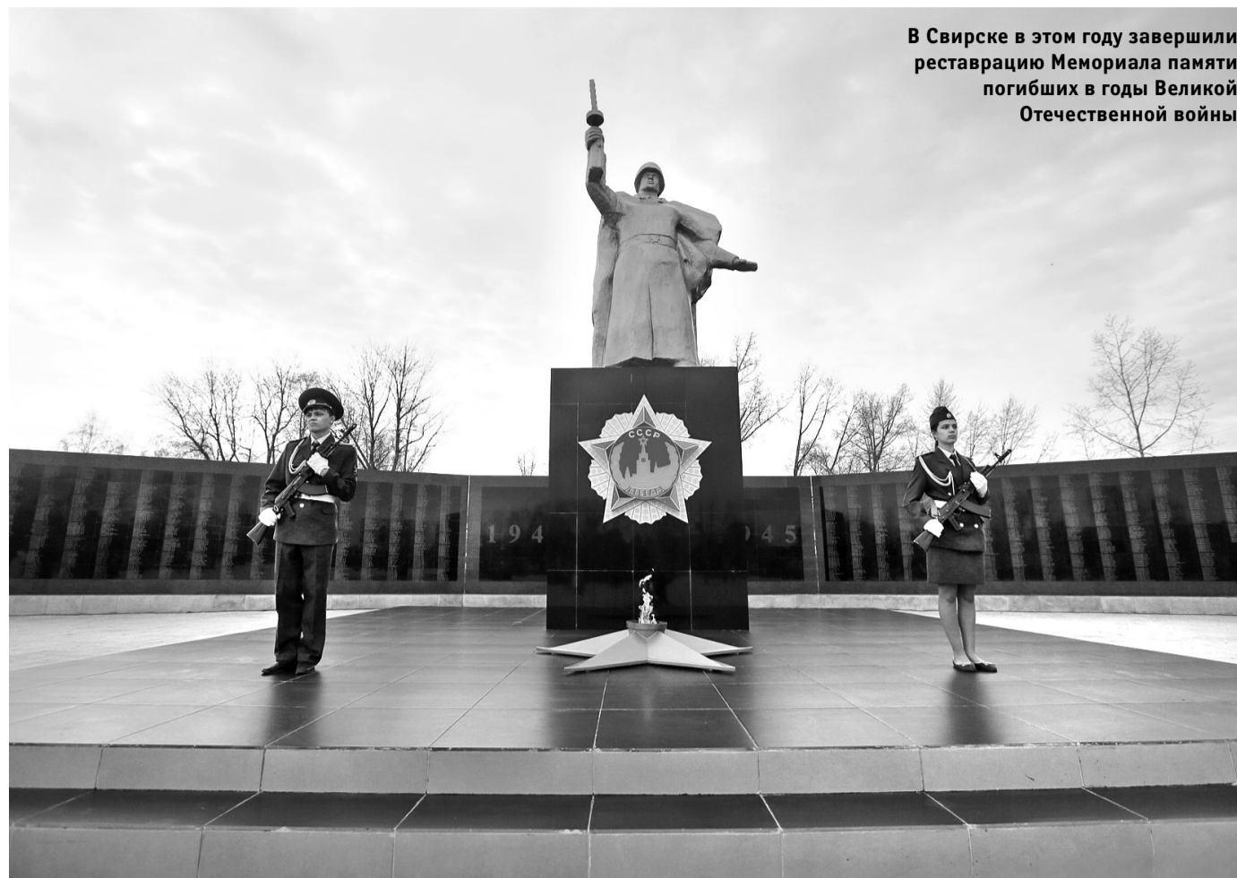
В Свирске в этом году завершили реставрацию Мемориала памяти погибших в годы Великой Отечественной войны