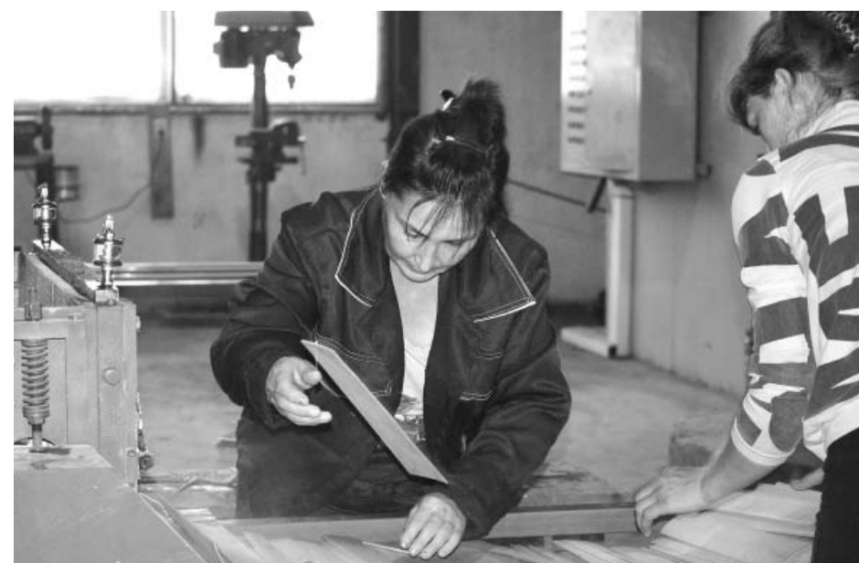
На поточной линии – разбраковка шпона