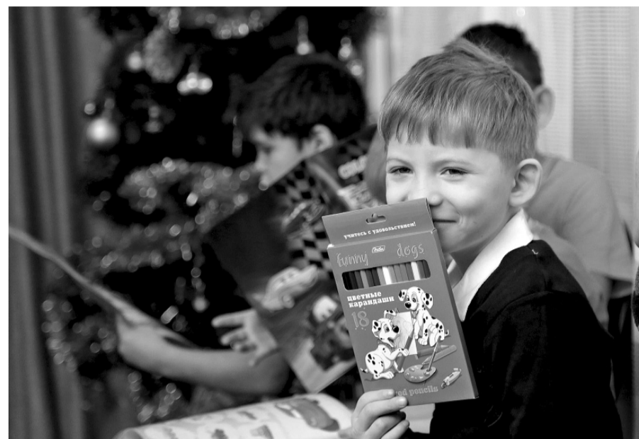
Дети в Иркутском центре помощи детям, оставшимся без попечения родителей

— А у нас есть черепаха, только у нее панцирь отпадет! — Мы ее посмотрим и обязательно вылечим, — обещает главный «айболит». — А почему у вас нет живого уголка? Вам бы хотелось, чтобы он появился? Радостный крик подтверждает, что предложение пришлось по душе. — Вы за каких животных голосуете? — За кошку! Собаку! Ежика! — несутся со всех сторон предложения.