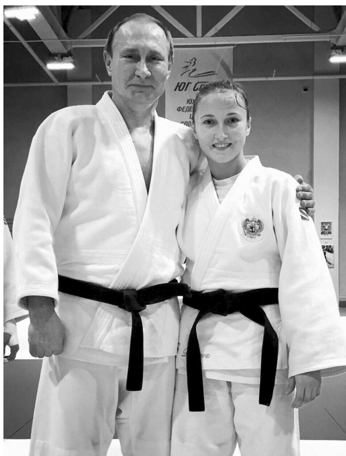
Президент России Владимир Путин с мастером спорта международного класса по дзюдо братчанкой Ириной Долговой