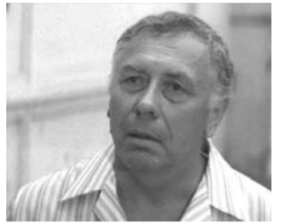
Герой фильма, недавно вышедший на пенсию, остается человеком энергичным и жизнелюбивым. И решил этот мужчина в полном расцвете сил, способный остано...