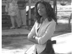
После успешного последнего дела профессиональный вор завязывает с криминалом и поселяется на райском острове. Его злейший враг, хитроумный агент ФБР, решат...

Режиссер Бретт Рэтнер. В ролях: Пирс Броснан, Сальма Хайек. США, 2004.