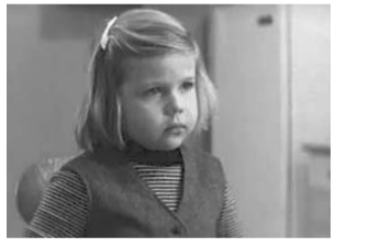
Сорокалетнего сына все еще опекает мать, мечтающая об идеальном браке. Но в размеренный быт пресуправляющего ученого врывается пятнадцатилетняя дочь...

Режиссер Юсуп Даниелов. В ролях: Леонид Куравлев, Татьяна Пельцер. СССР, 1982.