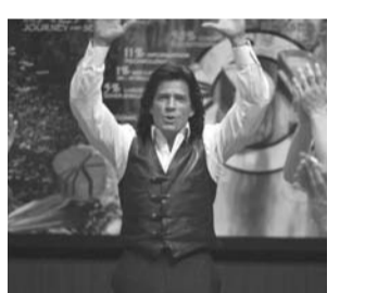
Эван Даниелсон - успешный финансовый аналитик, который так занят работой, что совсем не уделяет внимания своим домашним. Но однажды его карье...

Режиссер Кэри Киркпатрик. В ролях: Эдди Мерфи, Томас Хейден Чёрч. США, 2009.