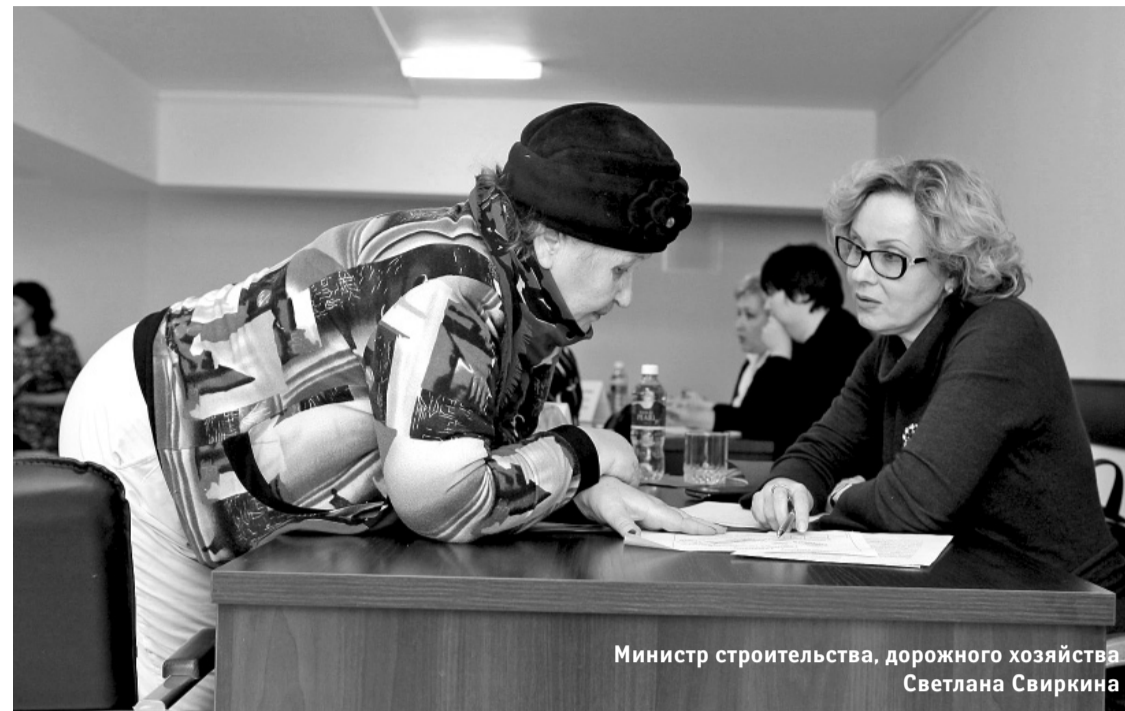
Министр строительства, дорожного хозяйства Светлана Свирикина

— У меня неспецифический язвенный колит, в прошлом году было бесплатное лекарство, а в этом его убрали из перечня. У меня просто нет средств, чтобы купить эти таблетки, они очень дорогие. Я инвалид II группы, министр