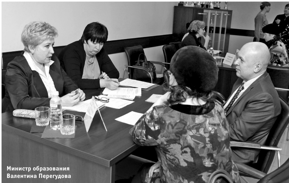
Министр образования Валентина Перегудова

Единственное, что может утешить Михаила Перова, это сообщение из уст замминистра, что в скором времени благодаря поправкам в закон льготу в 50% по взносам за капремонт домов