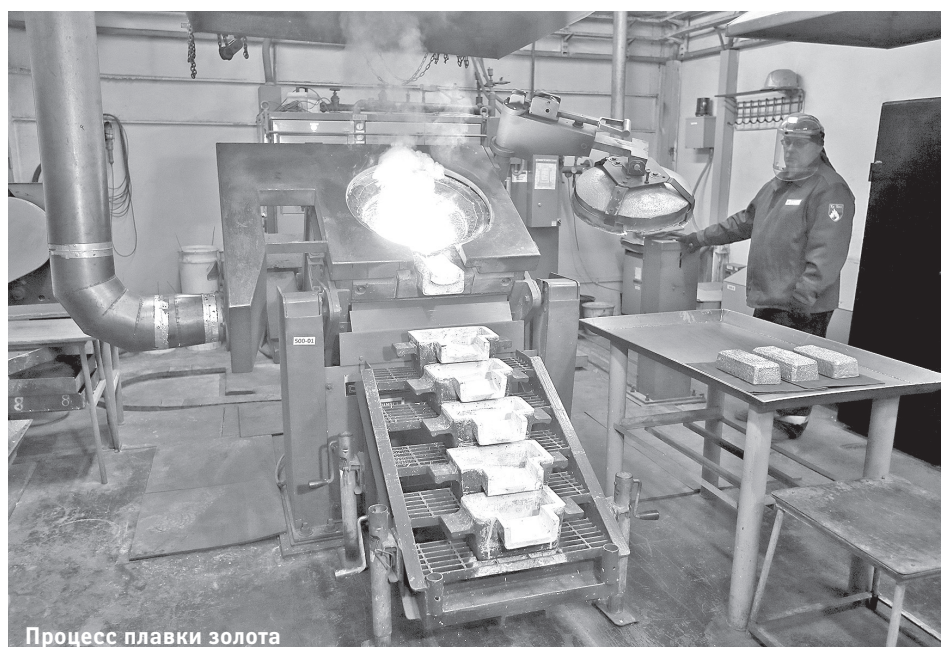
Процесс плавки золота

водителей – НКМЗ, FLSmidth, Weir Minerals, Metso Minerals. В 2015 году реализован целый комплекс мероприятий технического перевооружения ЗИФ, модернизации и замены отдельных агрегатов. Было установлено дополнительное оборудование для стабилизации и повышения эффективности работы технологических переделов фабрики.