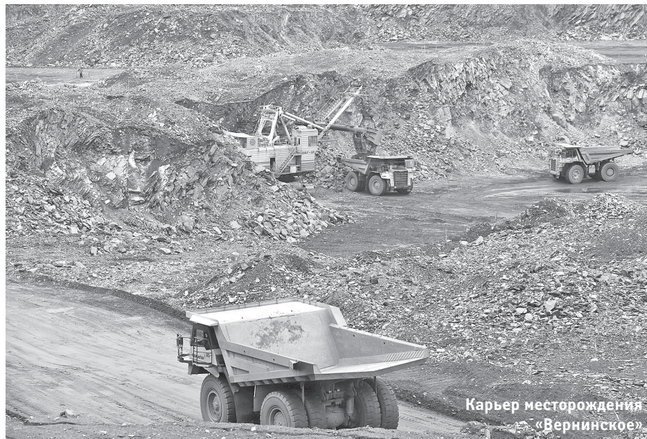
Карьер месторождения «Вернинское»

– За 2015 год – около 198 млн рублей. При этом стоит принять во внимание тот факт, что в случае реализации рационализаторского предложения работника и получения видимого эффекта от его внедрения, автор идеи получает определенное денежное вознаграждение. Конечно, для того чтобы придумать такое предложение, необходимо разбираться во многих произ-