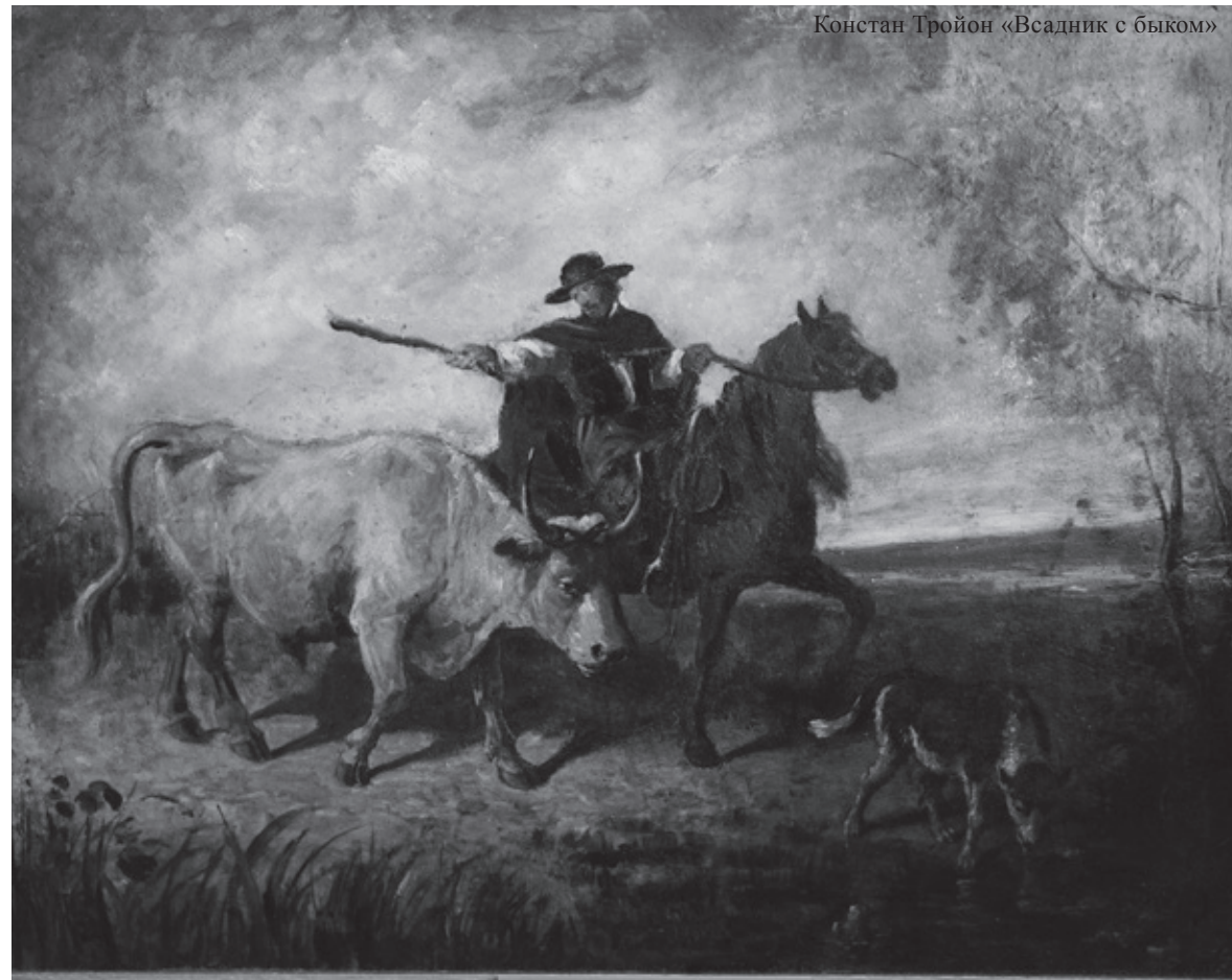
Констан Тройон «Всадник с быком»

Прекрасные нимфы, портреты мадонн, королей и придворных дам в роскошных рамах, а также работы известных художников — Констана Тройона, Нарциссо Диаса де ла Пеньи, Клода Моне, Камиля Писсарро — можно увидеть в основном здании Иркутского областного художественного музея им. В.П. Сукачева. С 28 января здесь работает выставка «Открываем запасы. Европейские мастера XVII — начала XX века». Она объединяет около 60 произведений французских, итальянских, немецких, английских, бельгийских и австрийских художников. В подобном составе полотна впервые представлены публике.