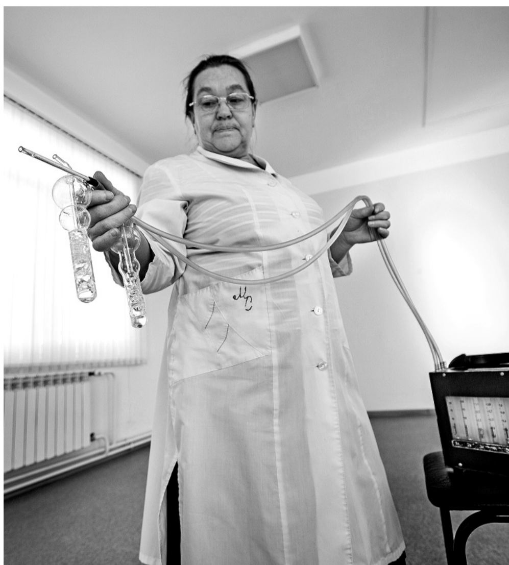
Специалисты Роспотребнадзора определяют, токсичны ли материалы, которые использовались при строительстве детсадов

Напомним, что практически все построенные в 2014 году в Приангарье детские сады в 2015-м были проверены