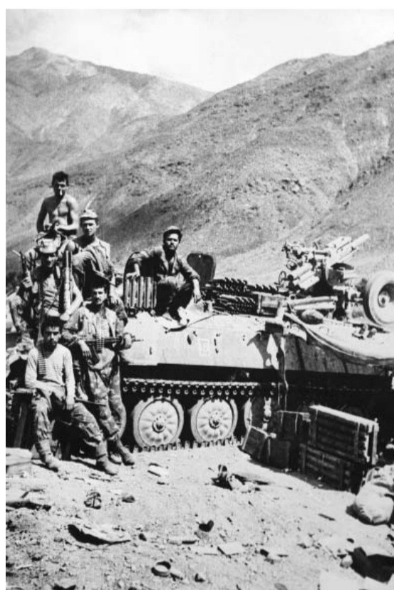
После боевой операции в провинции Пандшер

Задача разведбатальона — засадные действия, охрана блокпостов, перехваты вражеских караванов с оружием. Приходилось спасать экипажи сбитых в тылу душманов