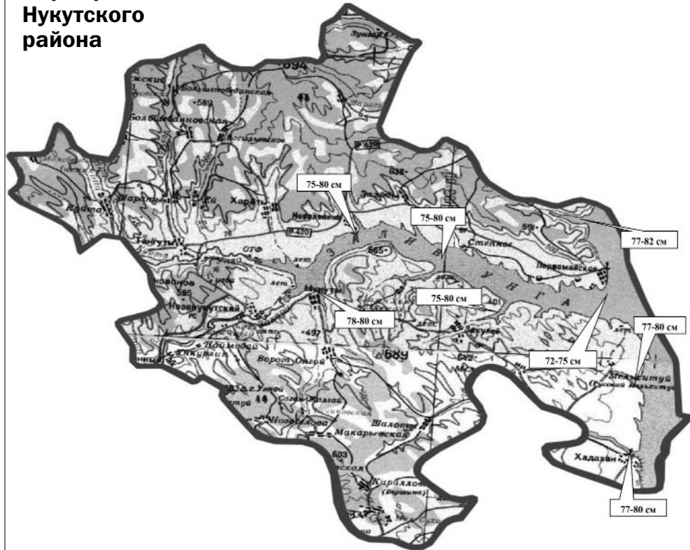
Карта рисков Нукутского района

На акватории Унгинского залива Братского водохранилища становление льда произошло в районе следующих населенных пунктов: