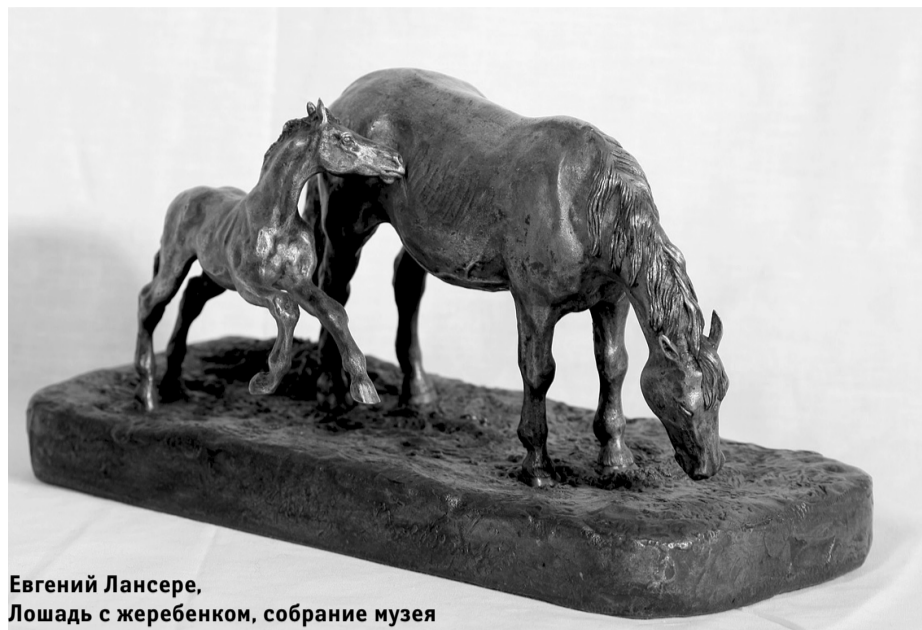
Евгений Лансеро. Лошадь с жеребенком, собрание музея

здании. Всего же в собрании пять его работ. Музей также гордится коллекцией произведений другого легендарного российского скульптора – Анны Голубкиной.