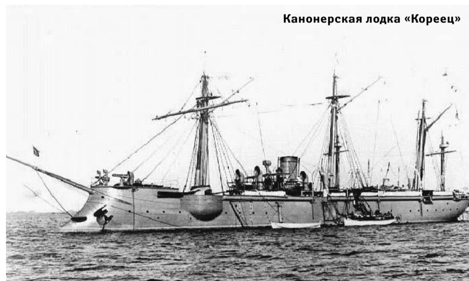
Канонерская лодка «Кореец»

Эта история началась в 2013 году. Старший преподаватель кафедры истории России ИГУ, заведующий отделом Иркутского областного краеведческо-