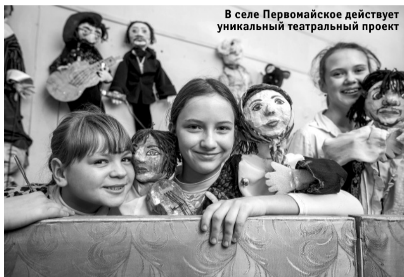
В селе Первомайское действует уникальный театральный проект

В селе Первомайское Нукутского района работает удивительный кукольный театр «Теремок». К празднику Сагаалгана артисты театра подготовили премьеру спектакля «Дева-Лебедь». Сегодня единственному в районе уникальному проекту требуется поддержка.