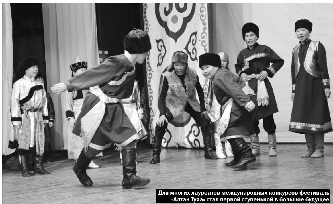
Для многих лауреатов международных конкурсов фестиваль «Алтан Туя» стал первой ступенькой в большое будущее

Фестиваль проводит Центр культуры коренных народов Прибайкалья при поддержке министерства культуры и архивов области. Организаторы признаются, что интерес к мероприятию растет с каждым годом. Все больше детей стремятся изучать бурятскую историю, родной язык, традиции. Если на первом фестивале оценивалась только хореография, то нынче в рамках конкурсной программы было четыре постоянных номинации: художественное слово, народная песня, фольклорные коллективы, хореография.