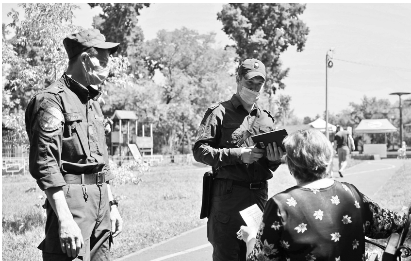
В центральном парке города казаки проводят беседы с ангарчанами о том, как не попасться на удочку телефонных мошенников