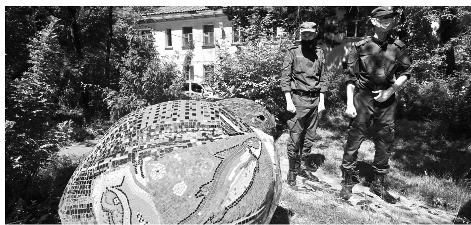
В ежедневный маршрут казачьих патрулей включили и мозаика-парк, который с недавних пор облюбовали вандалы