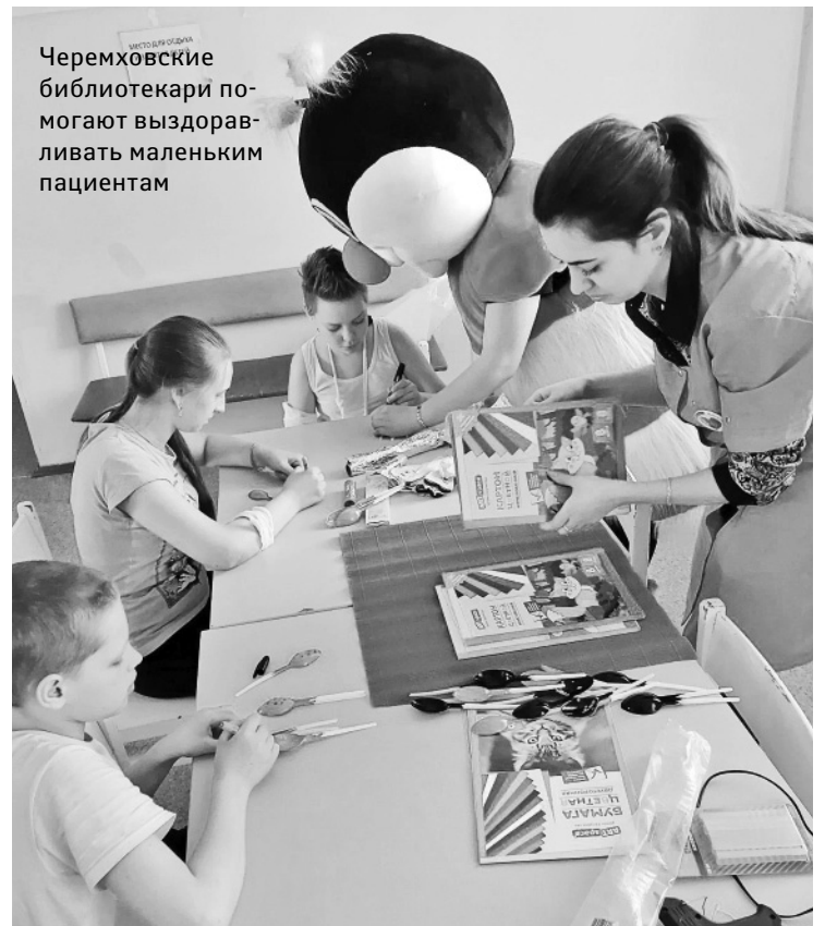
Черемховские библиотекари помогают выздороветь маленьким пациентам

К каждому визиту в больницу они долго готовят – куклы, декорации, игровой реквизит – ничего забыть нельзя. Потому что дети с нетерпением ждут их, больничных волонтеров, которые делают лечебные будни светлее и ярче.