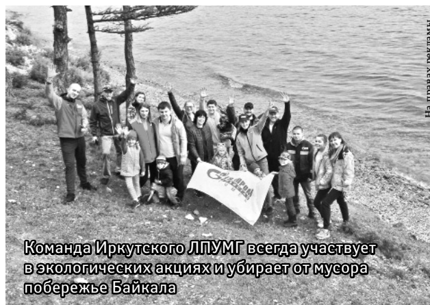
Команда Иркутского ЛПУМГ всегда участвует в экологических акциях и убирает от мусора побережье Байкала

Надежность и бесперебойное функционирование газотранспортного предприятия в первую очередь зависит от профессионализма персонала. В Иркутском ЛПУМГ за полтора десятка