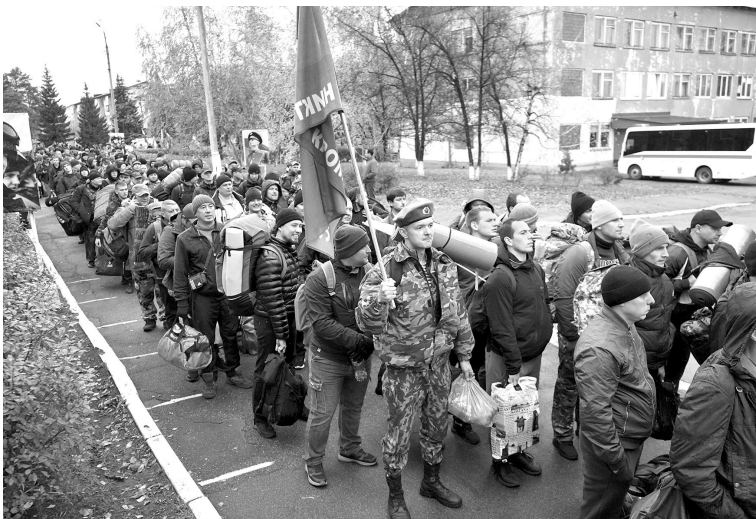
Следующая группа мобилизованных отправится из Приангарья в ближайшее время

■ АКТУАЛЬНО Первую группу жителей Иркутской области, призванных на военную службу по частичной мобилизации, отправили 27 сентября в учебную часть. Мужчин поприветствовал губернатор Игорь Кобзев. «Поговорил с мобилизованными, пожал им руки. В октябре приеду в училище, лично проверю, чтобы все у наших ребят было в порядке», – пообещал глава региона.