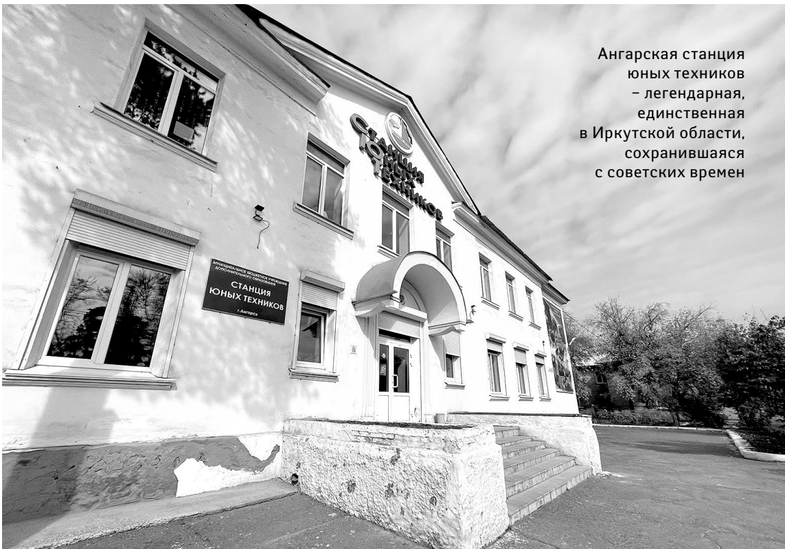
Ангарская станция юных техников – легендарная, единственная в Иркутской области, сохранившаяся с советских времен