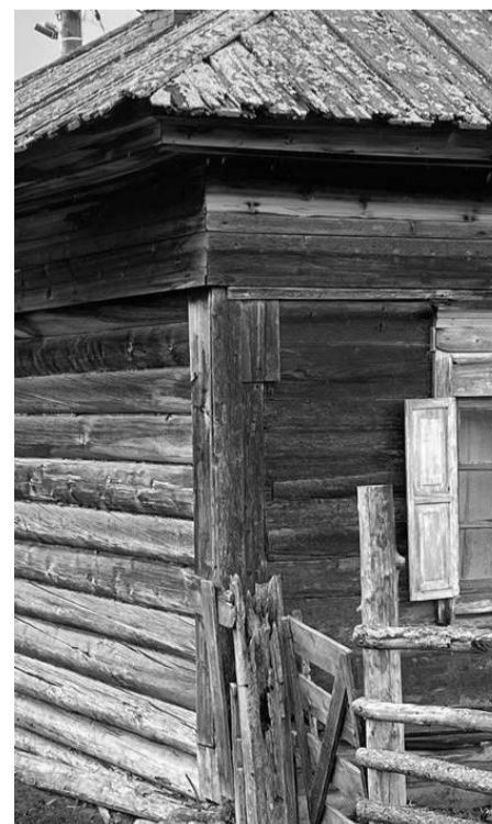
Фотография №4. Фрагмент северо-восточного и северо-западного фасадов объекта культурного наследия