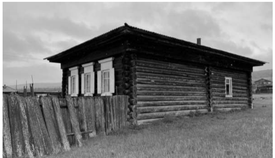
Фотография №2. Вид на юго-восточный-северо-восточный фасад объекта культурного наследия