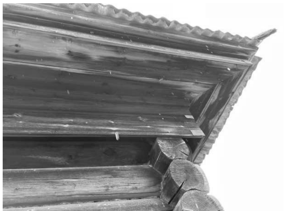
Фотография №4. Фрагмент северо-восточного фасада объекта культурного наследия