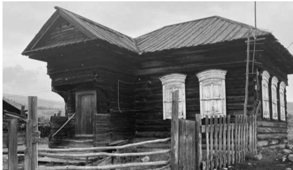
Фотография №1. Вид с пер. Северный на юго-восточный и юго-западный фасады объекта культурного наследия