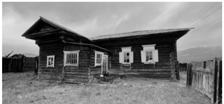
Фотография №3. Вид на юго-западный фасад объекта культурного наследия