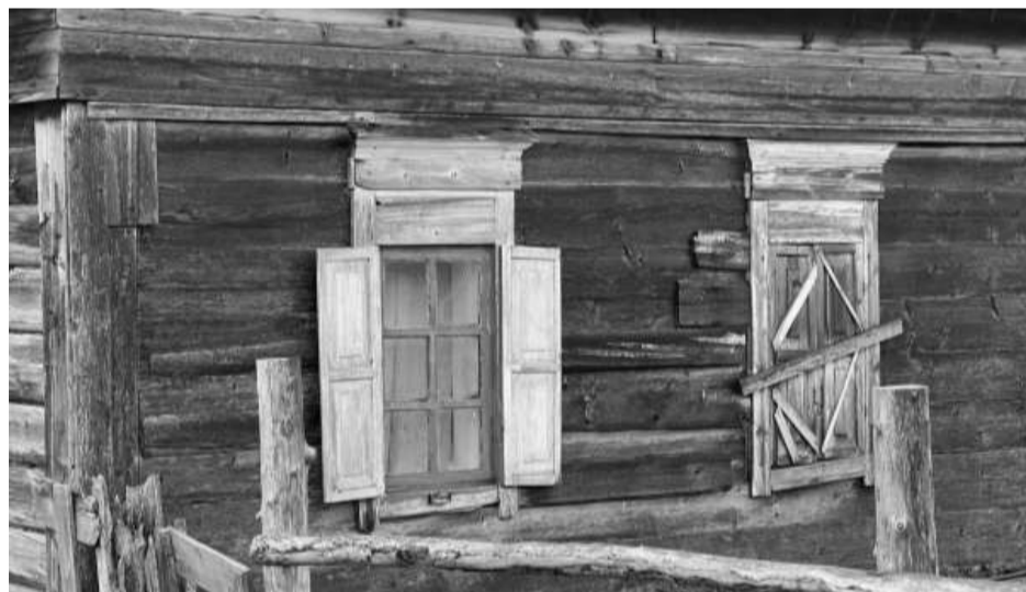
Фотография №3. Вид на северо-западный фасад объекта культурного наследия