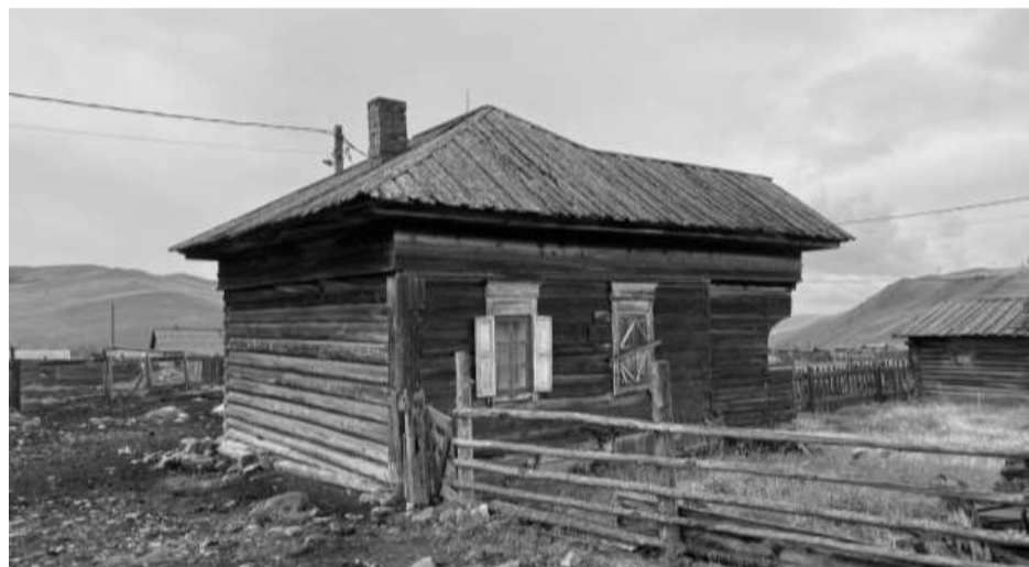
Фотография №2. Вид на северо-восточный и северо-западный фасады объекта культурного наследия