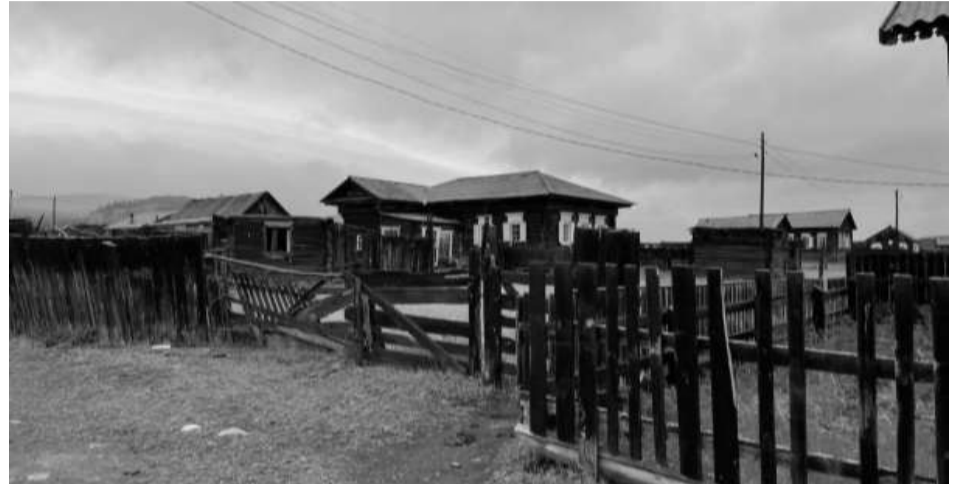
Фотография №1. Вид с ул. Солнечная на юго-восточный-западный фасад объекта культурного наследия