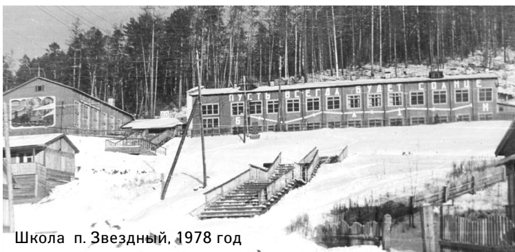
Школа п. Звездный. 1978 год