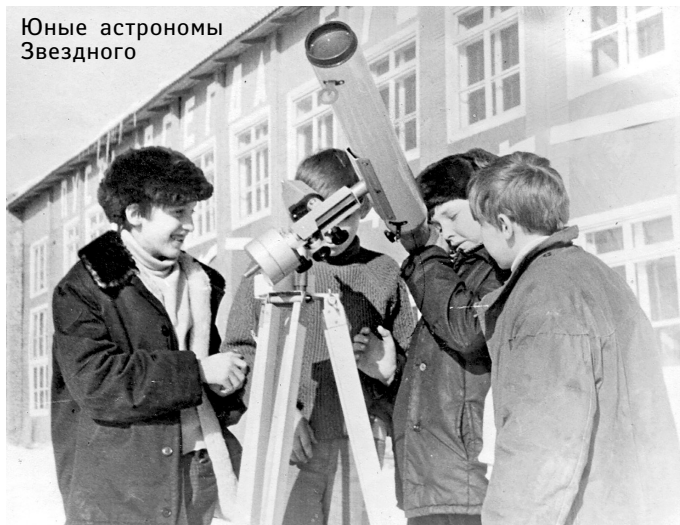
Юные астрономы Звездного

→ Когда вы приехали на БАМ, какой дух витал