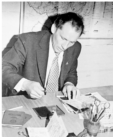
Подготовка аттестатов первого выпуска в школе

В палатке, где жили учителя, мне как директору отвели одноместный отсек, а когда приехал завуч, его ко мне подсадили. На первых порах было семь учеников и 15 дошколят. Учителя работали