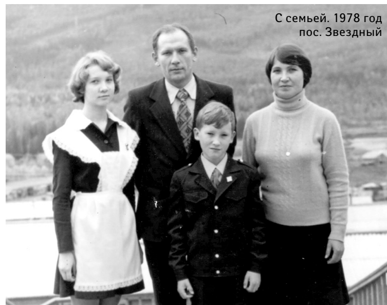
С семьей. 1978 год пос. Звездный

– Первым эту фразу сказал Егор Гайдар. Я не думаю, что он не понимал, что это мощнейший государственный проект века. Повторю, на века, а не на годы или на десятилетия. Он сказал это как конъюнктурщик: ему на-