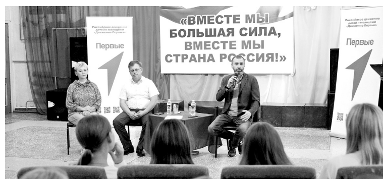
С молодежью Черемховского района у парламентария состоялся открытый диалог

✍ Юрий ЮДИН