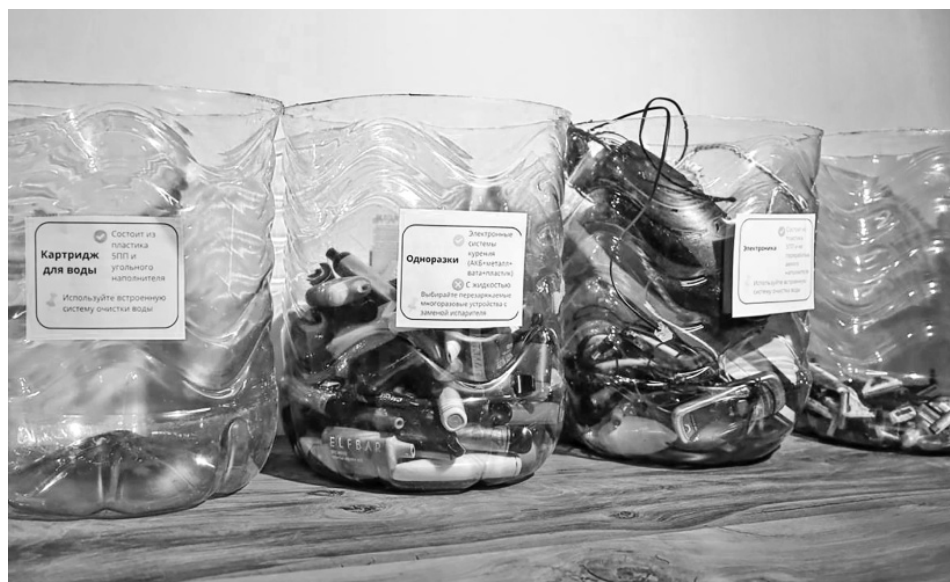
Зубные щетки, батарейки, пластиковые карты – всего здесь принимают на переработку 29 фракций вторсырья

– Родился ребенок, и вот мы за полтора года подобрали. Я мониторию экодвижение, из социальных сетей узнала об этой точке. Бывает, еще проводится «Гаражка»