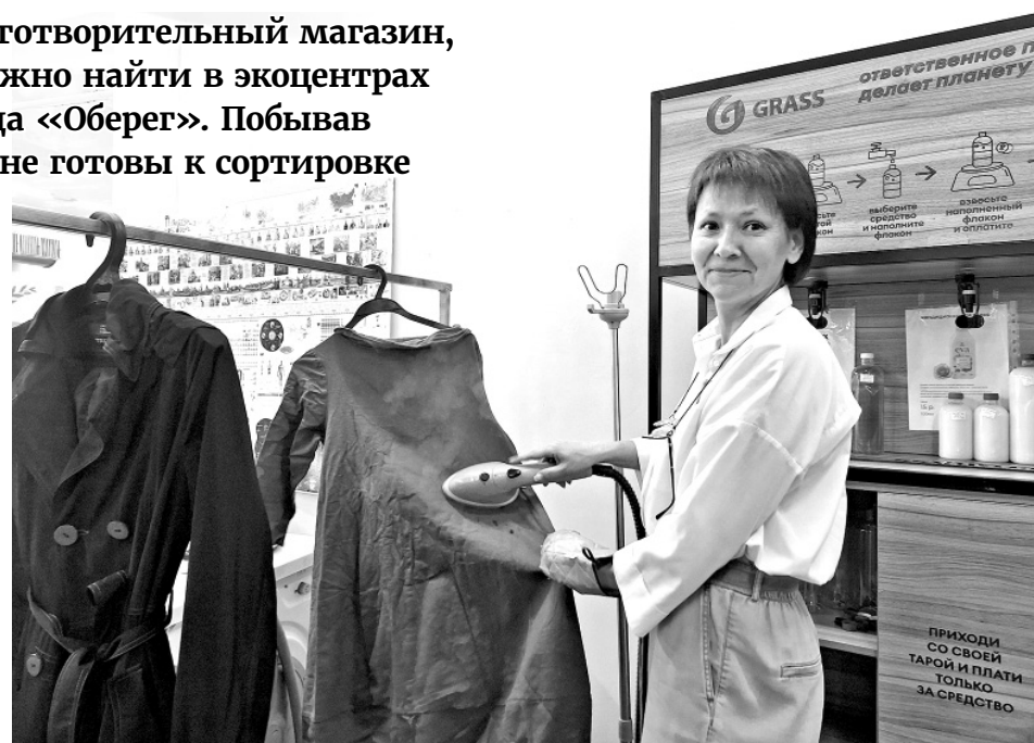
Сотрудник экоцентра готовит одежду к продаже в благотворительном магазине