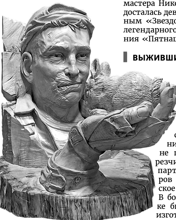
Позывной «Казань», скульптура

– Первое, что пришло в голову, были ложки, – вспоминает Ивченко. – Но, честно, сомневались. С одной стороны, еще с суворовских времен русские солдаты носили за голенищем ложку, которая была для них таким же ору-