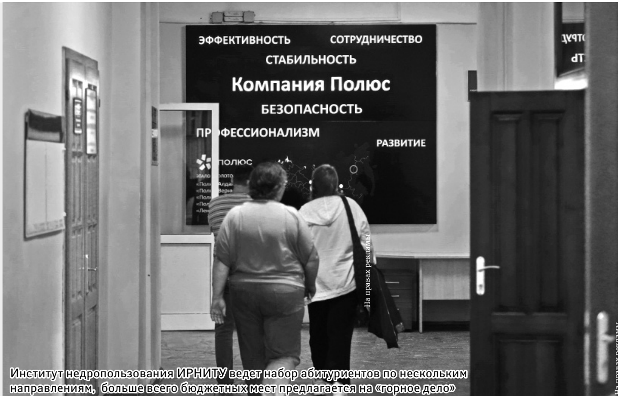
Институт недропользования ИРНТУ ведет набор абитуриентов по нескольким направлениям, больше всего бюджетных мест предлагается на «горное дело»

■ КОМПАНИЯ До 25 июля Иркутский национальный исследовательский технический университет принимает заявления от абитуриентов, которые планируют обучаться перспективным специальностям на бюджетной основе. В этом году Институт недропользования ИРНТУ предлагает им 276 мест, из них 150 – по направлению «горное дело». Оно считается одним из самых востребованных, в том числе в золотодобыче. Многие выпускники вуза смогут трудоустроиться в золотодобывающую компанию «Полюс», которая давно и плодотворно сотрудничает с Иркутским политехом.