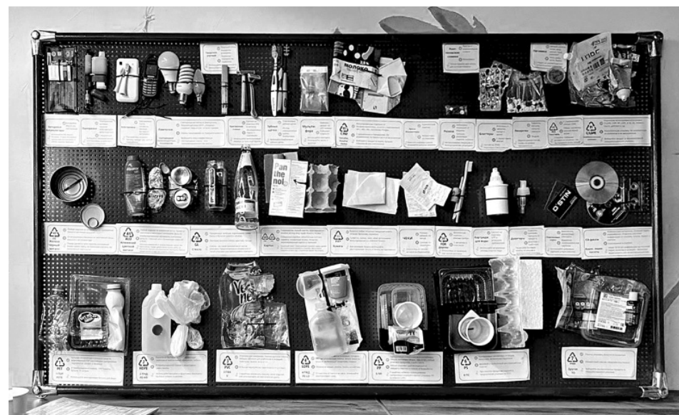
В экоцентре вас научат сортировать мусор с помощью специального стенда