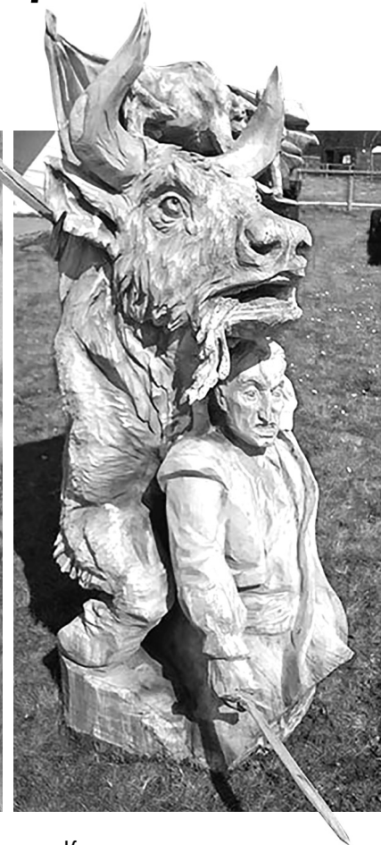
Кровь и песок