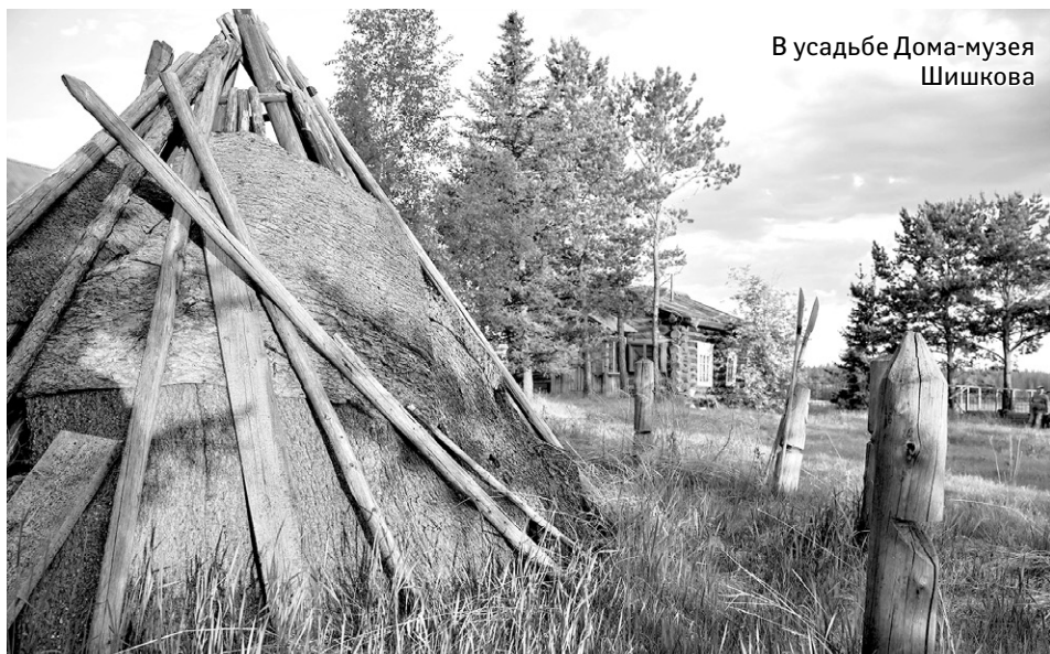
В усадьбе Дома-музея Шишкова

Удача улыбнулась журналистам уже на стадии подготовки к походу, когда лодка-плоскодонка еще