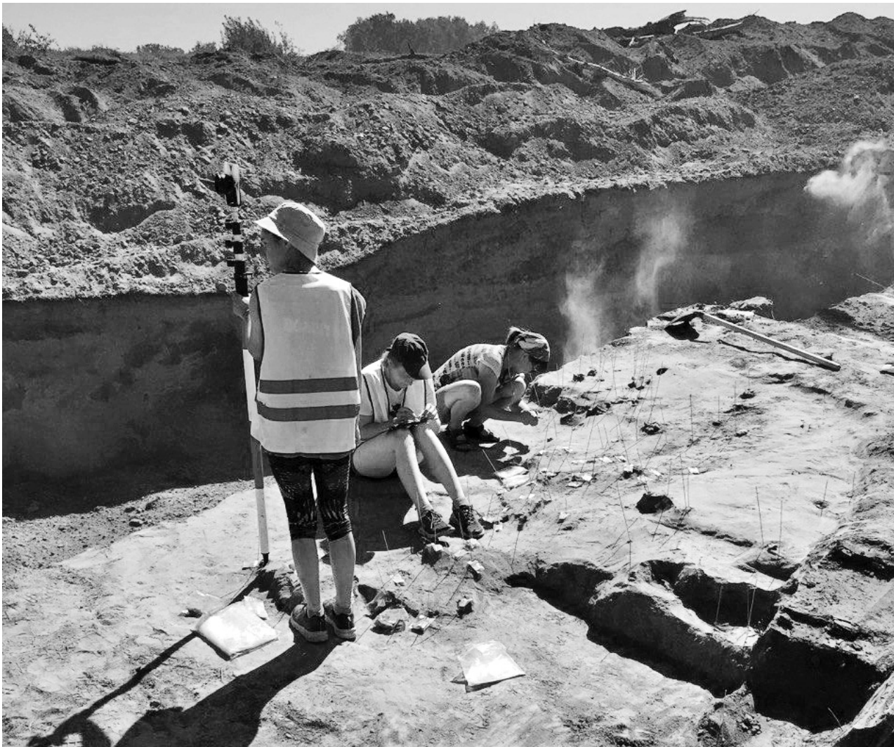
Перед тем, как начать стройку, по закону нужно провести обязательную археологическую экспертизу. На фото – место ведения раскопок на объекте «Мальта. Мост-3» в районе возведения объездной автодороги вокруг Усолья-Сибирского

пень хозяйственного освоения. Сказывается и труднодоступность местности. В целом ежегодно в Иркутской области выявляется 15–20 объектов археологии.