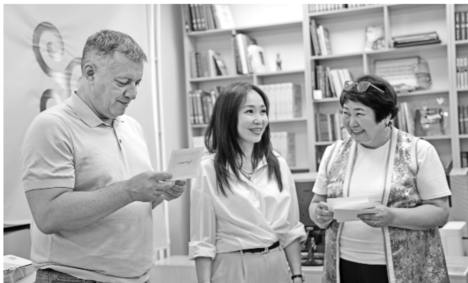
В селе Оса губернатор посетил Межпоселенческую библиотеку, которую модернизируют по нацпроекту «Культура»