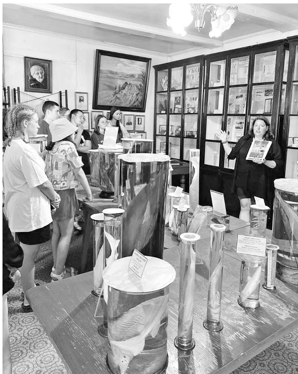
Занятия со школьниками в аудитории университета