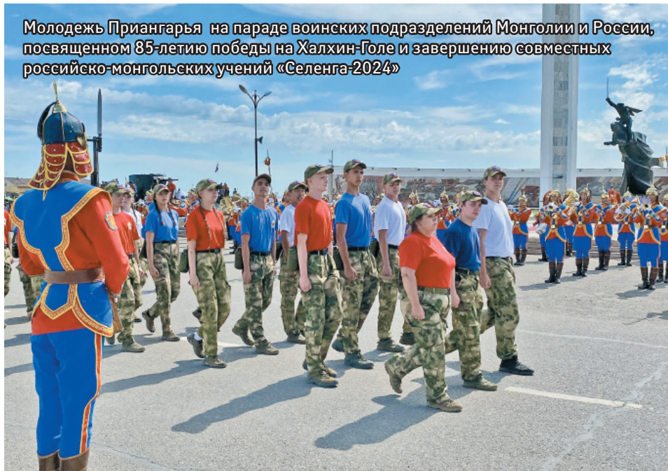
Молодежь Приангарья на параде воинских подразделений Монголии и России, посвященном 85-летию победы на Халхин-Голе и завершению совместных российско-монгольских учений «Селенга-2024»