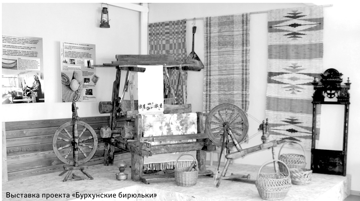
Выставка проекта «Бурхунские бирюльки»

– Мне поставили страшный диагноз – онкологию. Где-то год я проходила лечение, потом была реабилитация. А когда мне полегчало, решила, что нужно заниматься творчеством, ведь я всегда рисовала. Начала осваивать лозоплетение, сначала на одну выставку пригласили, потом на другую, познакомилась с мастерами. И меня затянуло.