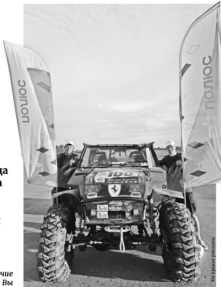
В поездке на чемпионат России спортсменам помог «Полюс»

В случае с трофи гонки длятся 24 часа за городом. Там, далеко в тайге, борешься сам с собой. Конкурентов не видишь. Участники разъезжаются в разные стороны, проходят обязательные контрольные точки. Каким маршрутом ты туда доберешься – твой выбор. Через сутки финишируешь, результат узнаешь не сразу.