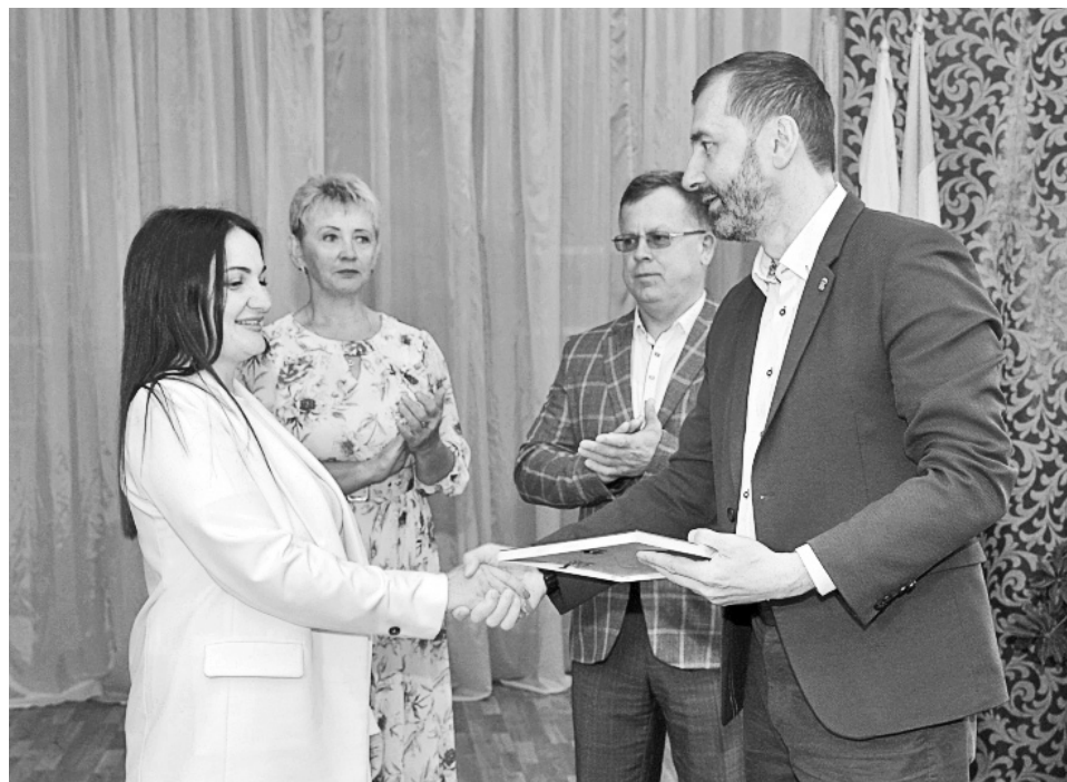
Три культурных учреждения Черемховского района получают средства на развитие в рамках областного закона об инвестиционном налоговом вычете для бизнеса