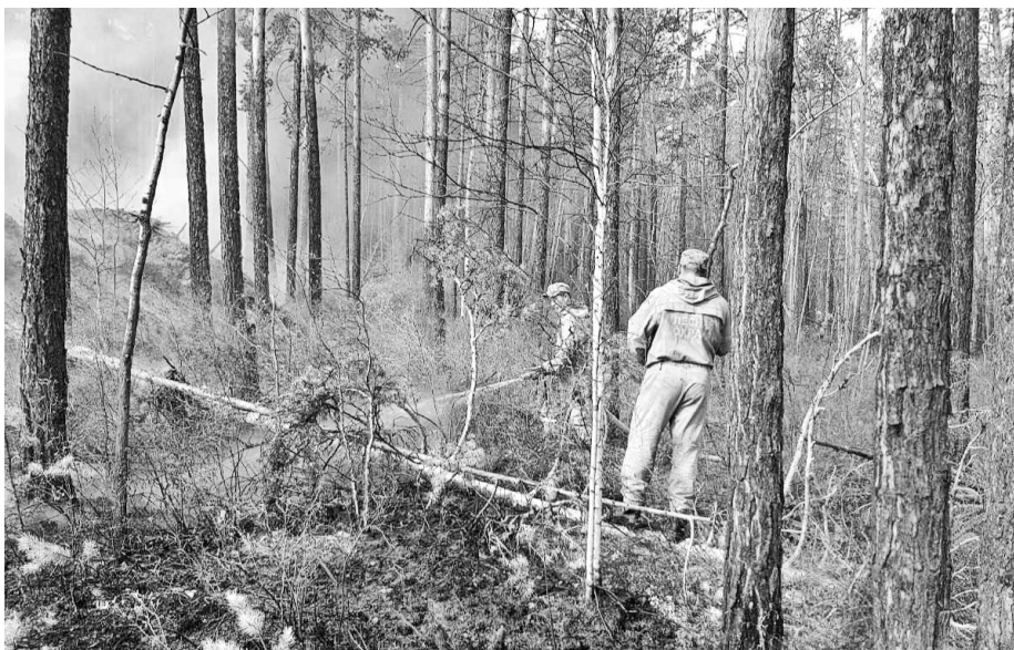
В этом году Иркутская область хорошо подготовилась к пожароопасному сезону, как по составу лесных пожарных, так и по наличию техники

ее вдвое. Всего же в Приангарье действуют 42 лесных питомника, в том числе у арендаторов лесных участков.