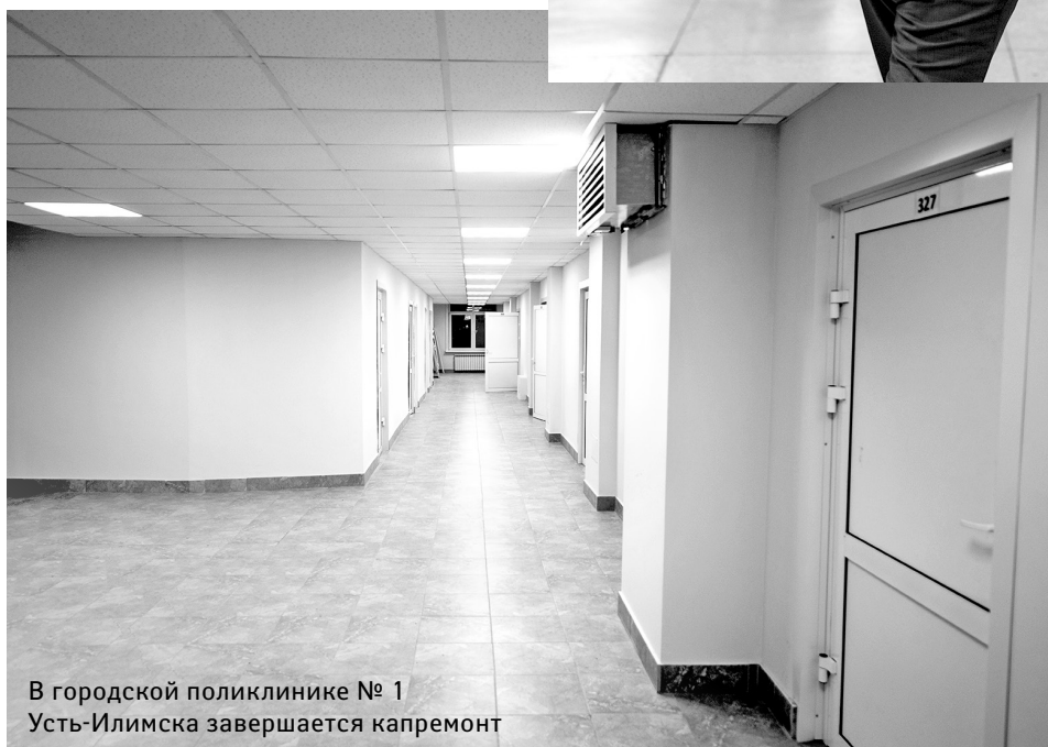
В городской поликлинике № 1 Усть-Илимска завершается капремонт