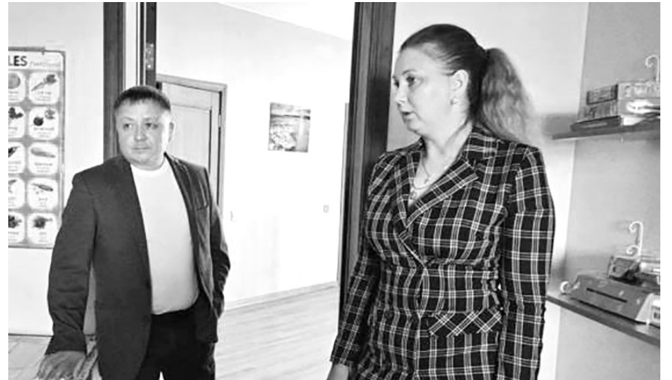
ГРАФИК ЛИЧНОГО ПРИЕМА ГРАЖДАН ЗАМЕСТИТЕЛЕЙ ПРЕДСЕДАТЕЛЯ ЗАКОНОДАТЕЛЬНОГО СОБРАНИЯ ИРКУТСКОЙ ОБЛАСТИ, ПРЕДСЕДАТЕЛЕЙ КОМИТЕТОВ, КОМИССИЙ ЗАКОНОДАТЕЛЬНОГО СОБРАНИЯ ИРКУТСКОЙ ОБЛАСТИ НА НОЯБРЬ 2024 ГОДА