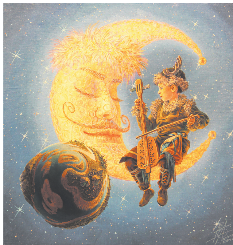
«Месяц и мальчик» (эвенкийская сказка), 2024, холст, масло

– Сказку читаю полностью, пытаюсь вникнуть, ухватить какой-то момент для иллюстрации. Время было весьма ограничено, в среднем на создание одной