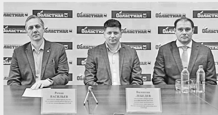
Ученые Института солнечно-земной физики СО РАН рассказали о космической погоде

■ НАУКА Октябрьская магнитная буря на Земле, по словам ученых, достигла высшего уровня. Многие почувствовали и даже увидели ее последствия. Для науки такие явления представляют особый интерес, рассказали иркутские ученые.