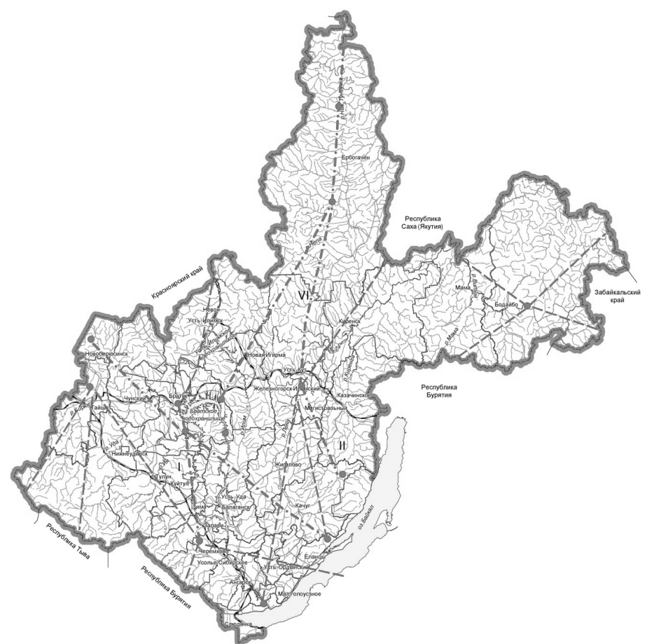
Схема путей миграций, массового гнездования, зимовок и остановок на отдых прибрежных птиц Иркутской области масштаб 1:5 350 000