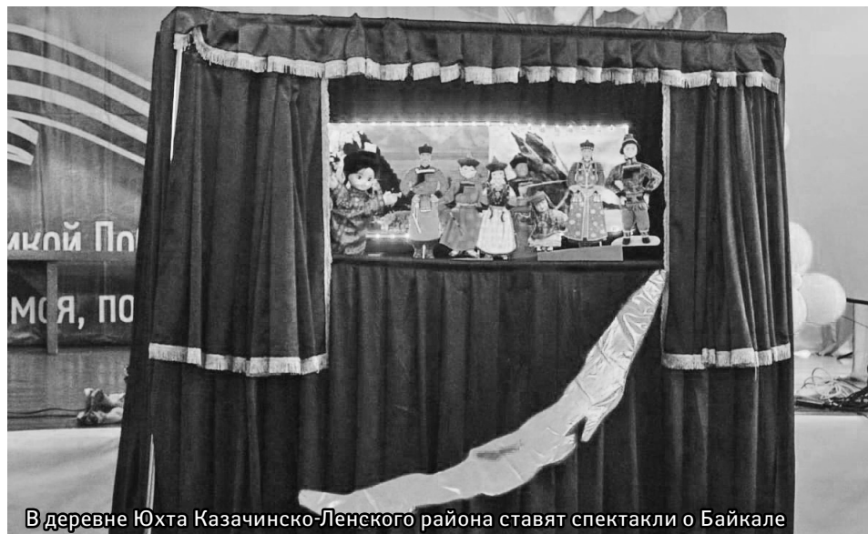
В деревне Юхта Казачинско-Ленского района ставят спектакли о Байкале