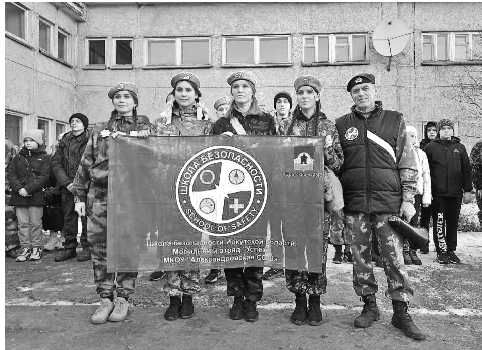
На базе Александровской школы в этом году прошел отборочный этап на областные соревнования «Юный спасатель»

– Огневая, строевая, тактическая и физическая подготовка, которую заменили на рукопашный бой. Оборудовали полосу препятствий, два года назад ввели тропу разведчика. Помогает нам совет ветеранов боевых действий района, у нас получился хороший тандем, они закупают на свои деньги пиротехнику – гранаты, растяжки. Практическую помощь оказывают спецназовцы, в том числе обладатели краповых беретов.