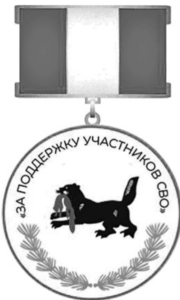
Эскиз почетного знака «За поддержку участников специальной военной операции»