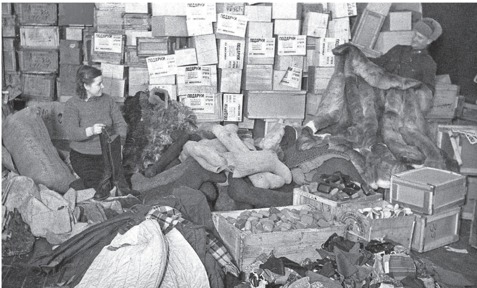
Подарки для бойцов Красной Армии.

Товарищи, для выполнения своих разбойничьих планов фашистские правители бросили на нашу любимую родину полчища вооруженных до зубов войск. Советский народ вступил в смертельную схватку с этим опасным врагом. Красная армия не только героически отражает нападение врага, но и наносит смертельные удары, уничтожая его живую и материальную силу. Враг несет громадные потери.