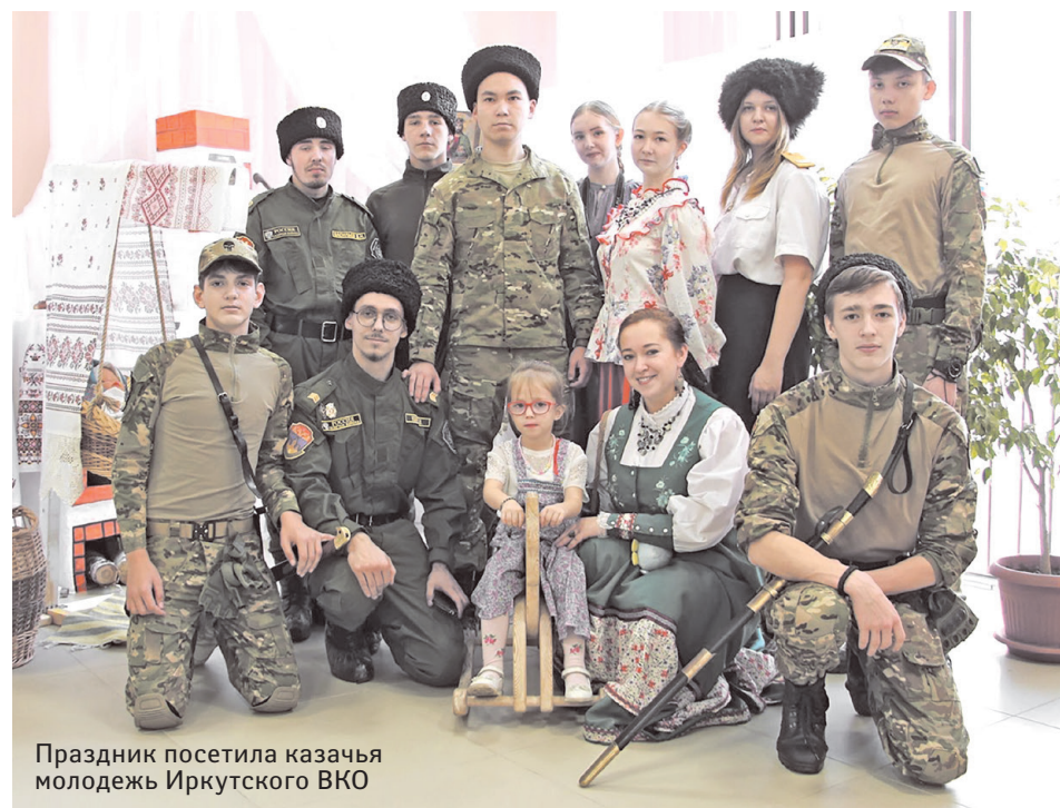
Праздник посетила казачья молодежь Иркутского ВКО