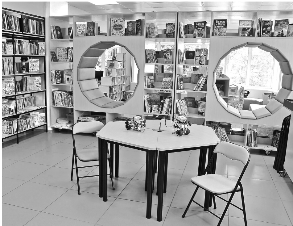
В модельной библиотеке Железногорска-Илимского откроют пространство семейных игротехнических мастерских

В пятерку победителей от Иркутской области, получивших в этом году крупные гранты в размере от 2,1 млн рублей до почти 5 млн рублей, вошли Иркутский центр абилитации с проектом «Успеть вовремя. Вместе с доктором», Иркутская областная общественная организация инвалидов детства «Надежда» (проект «Центр «Надежда» – территория добра и созидания»), АНО «Добровольческий спасательный отряд 111.62» («Расширение видов деятельности Многофункционального добровольческого центра»), молодежный благотворительный фонд «Возрождение земли сибирской» («Экологичным быть выгодно!») и Иркутская городская общественная организация «Человек Иркутска» (проект «Фасадник»).