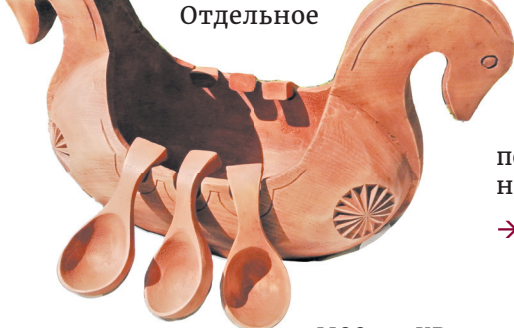
Отдельное мое увлечение –

обладает особым ароматом. Бывает, когда вечером нечем заняться, берешь кусочек дерева и воплощаешь в нем образы, которые у тебя в голове. Кроме того, хочется это ремесло детям передать, ведь в школах очень мало уделяют внимания обработке древесины, даже на уроках труда в основном изучают теорию, а родителям некогда ребят этому учить. Обработка дерева – наше народное ремесло. Мне, кстати, всегда была интересна история, я ее начал изучать еще до того, как получил высшее художественное образование.