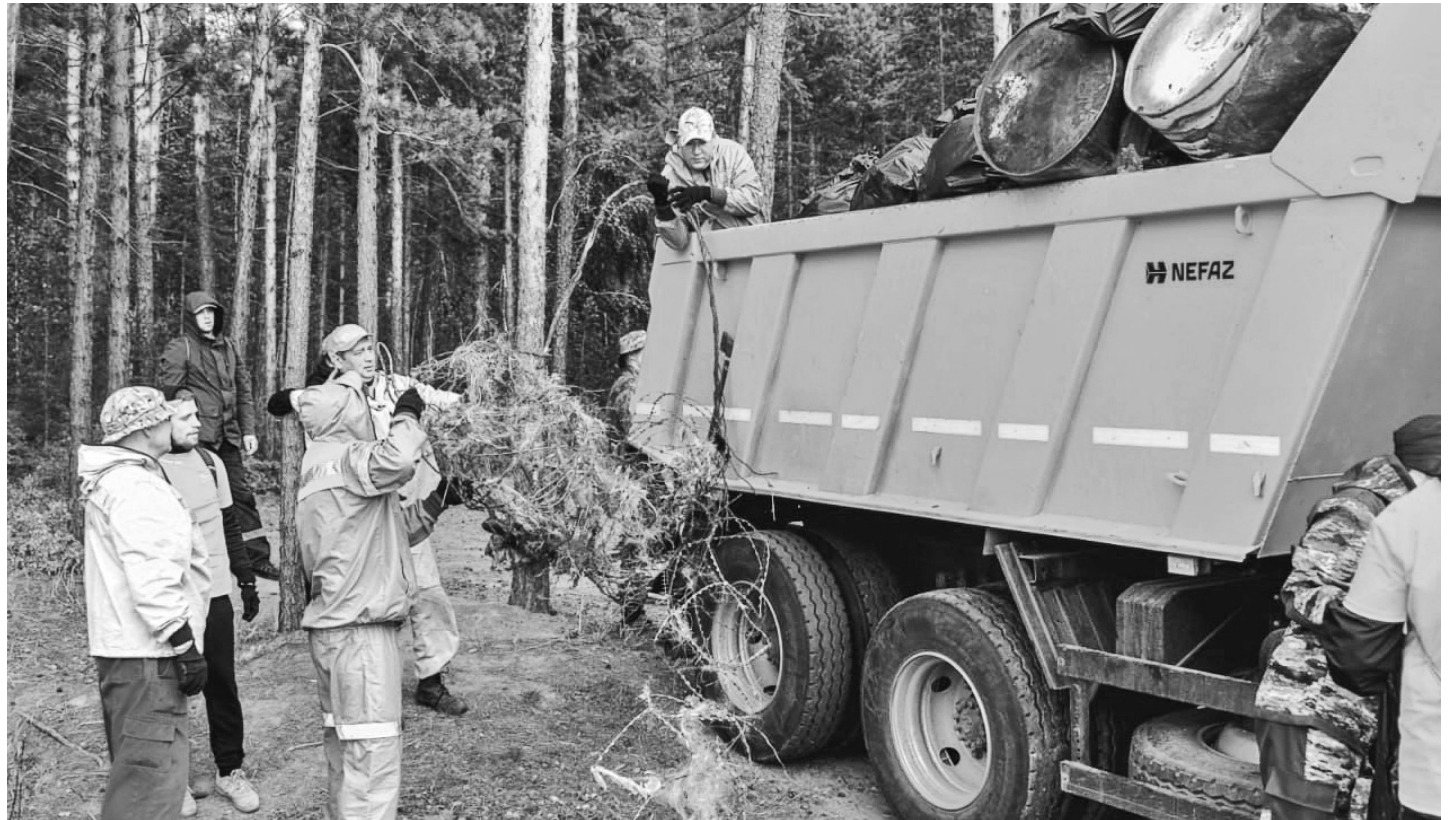
68 несанкционированных свалок ликвидировали в лесах региона в 2024 году

В лесах стали проводить больше контрольно-надзорных профилактических мероприятий и патрулирования. Для выявления и пресечения незаконных рубок проводится дистанционный космический мониторинг лесов, который охватывает больше полови-