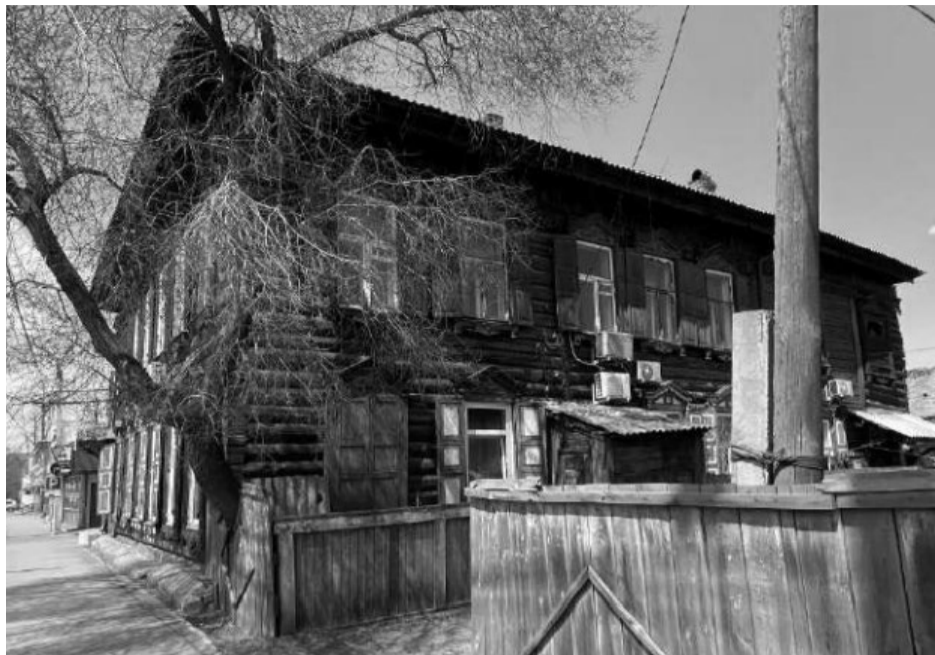
Фото 2 – Боковой (юго-восточный) фасад

Приложение 3 к предмету охраны объекта культурного наследия регионального значения «Доходный дом Федосеевой», 1890-е гг., расположенного по адресу: Иркутская область, городской округ город Иркутск, город Иркутск, улица Баррикад, дом 71