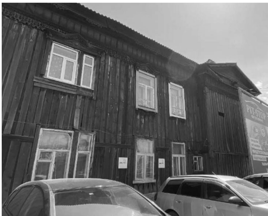
Фото 4 – Фрагмент бокового фасада