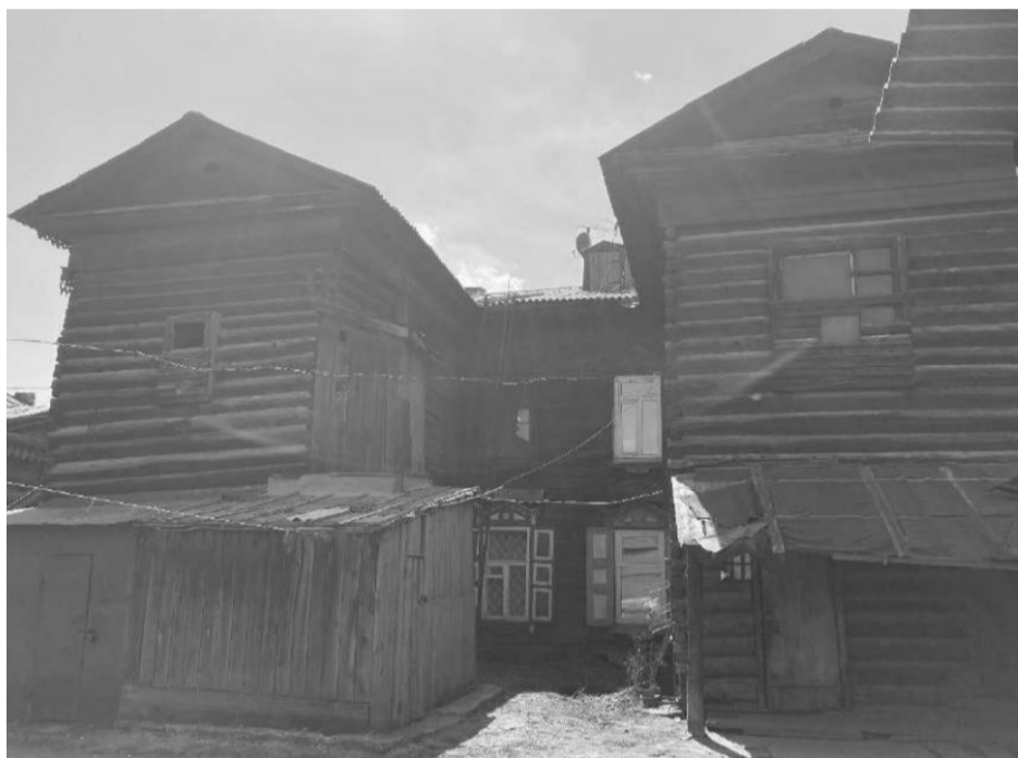
Фото 3 – Общий вид на здание со стороны двора