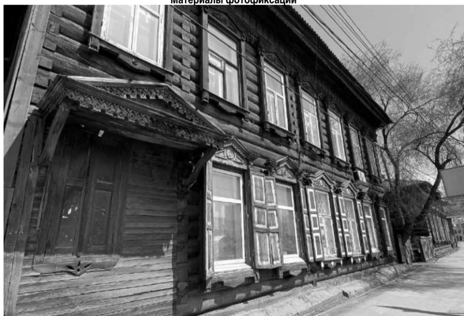
Фото 1 – Общий вид на исследуемый объект с западного направления