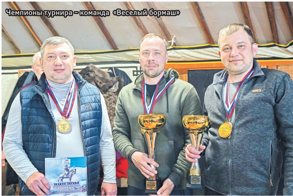
Чемпионы турнира – команда «Веселый бормаш»