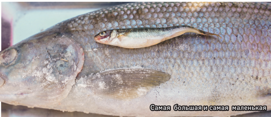
Самая большая и самая маленькая