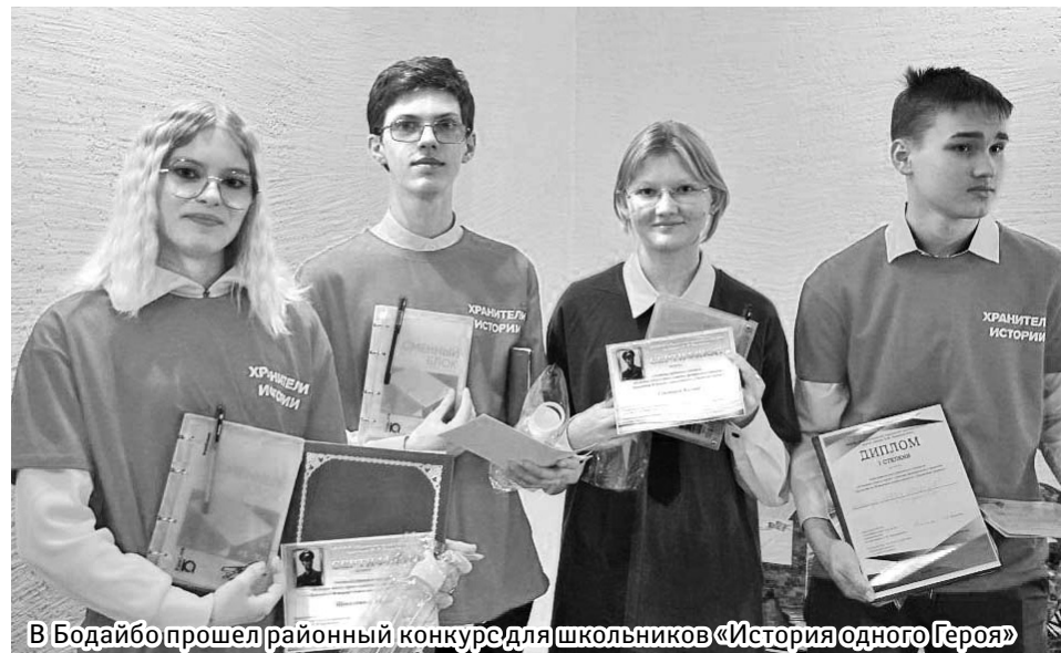
В Бодайбо прошел районный конкурс для школьников «История одного Героя»

И после легендарный летчик служил на защите неба Родины, получив множество званий и наград. Евгения Пепелева не стало 4 января 2013 года.